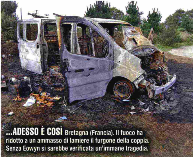
...ADESSO È COSÌ Bretagna (Francia). Il fuoco ha ridotto a un ammasso di lamiere il furgone della coppia. Senza Eowyn si sarebbe verificata un'immense tragedia.

dormivamo. Il cane ha iniziato a dondolare per avvisarci del pericolo»