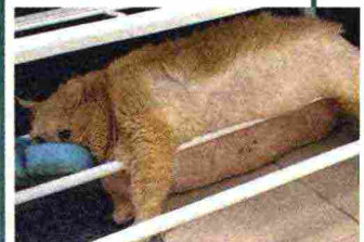
Il micione è rimasto incastrato fra le sbarre di una scarpiera. È arrivato a pesare 17 chili.

La dieta non faceva proprio per lui, e così un micione di 17 chili ha tentato la fuga dalla clinica in cui era stato ricoverato per dimagrire. Per sua sfortuna, però, è rimasto incastrato in una scarpiera mentre cercava una via di fuga ed è stato riportato in... corsia.