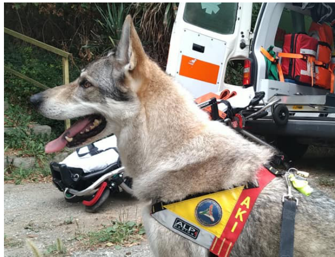
Akela ha permesso di ritrovare un anziano disperso a San Quirico

tà dell'uomo verso gli animali, mai troppa.