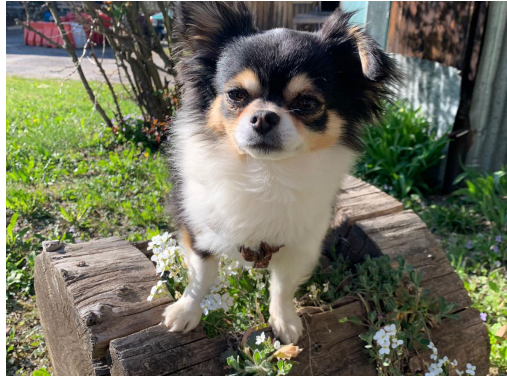
Brown che ha salvato la sua vicina di casa e Amon rimasto 4 giorni con la sua padrona ferita